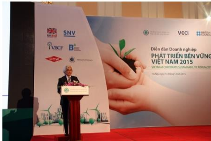
Trong thời gian ở Việt Nam, Tổng thư ký APO đã tham gia phát biểu tại Diễn đàn Doanh nghiệp phát triển bền vững Việt Nam 2015 vào ngày 14/5/2015 tại Hà Nội.